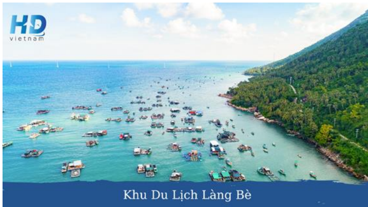
Khu Du Lịch Làng Bè

07h30: Đoàn sẽ đón chuyến tàu đến với Hòn Sơn Rái - Phong cảnh tại Hòn Sơn nói chung vẫn còn