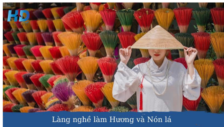
Làng nghề làm Hương và Nón lá