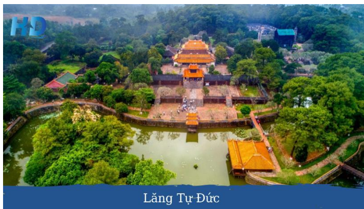
Lăng Tự Đức

Buổi sáng: Quý khách dùng buffet sáng tại khách sạn. Tham quan Lăng Tự Đức – được mệnh danh là một trong những công trình đẹp nhất thời nhà Nguyễn, với kiến trúc mang đậm nét truyền thống nhưng tinh tế, bao bọc bởi một không gian xanh mướt của cây xanh và hồ nước hòa quyện tạo cảm giác rất nên thơ và hữu tình. Quý khách tiếp tục đến với Làng nghề làm Hương và Nón lá – là làng nghề truyền thống lâu đời ở xứ Huế, nơi đây thu hút rất nhiều du khách thích sống ảo bởi khung cảnh rực rỡ của những bó hương đa sắc xanh, đỏ, tím, vàng.