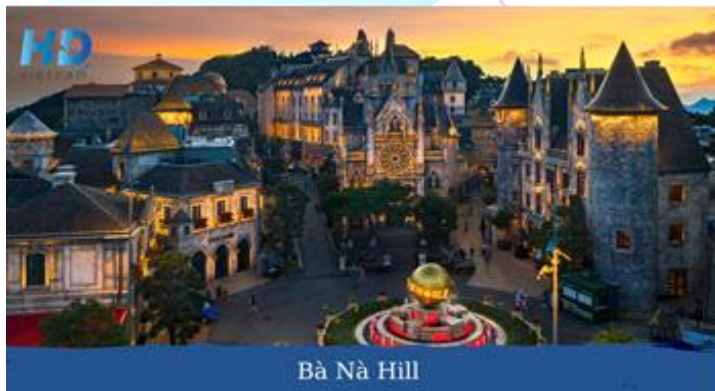
Bà Nà Hill

khách tiếp tục khởi hành đến khu du lịch Bà Nà ( Tự túc chi phí Option Bà Nà theo giá của Sun Group ). Quý khách được chiêm ngưỡng hệ thống cáp treo lập nhiều kỷ lục thế giới và được công nhận là 1 trong 10 hệ thống cáp treo ấn tượng nhất thế giới.