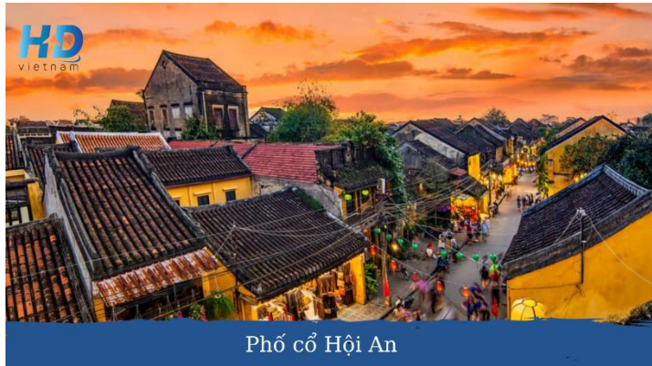
Phố cổ Hội An

Buổi chiều: Khởi hành đến bán đảo Sơn Trà -rừng già giữa lòng phố trẻ. Xe đưa quý khách dọc theo triền núi Đông Nam để chiêm ngưỡng vẻ đẹp tuyệt mỹ của Đà Nẵng. Viếng Linh Ứng Tự - nơi