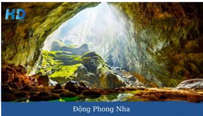
Động Phong Nha

Buổi chiều: Quý khách tham quan động Phong Nha (hoặc có thể chọn động Thiên Đường ) khám phá vẻ đẹp được ví là Đệ Nhất Kỳ Quan Động với hang Khô rộng và đẹp nhất sau đó ngồi thuyền trên sông Son tham quan hang động nước dài nhất hoặc quý khách có thể chọn tham quan động Thiên Đường với lối dẫn bằng cầu gỗ dài 1km, chiêm ngưỡng các khối thạch nhũ tuyệt đẹp được ví là Hoàng Cung trong lòng đất. Sau đó quý khách khởi hành về lại Huế.