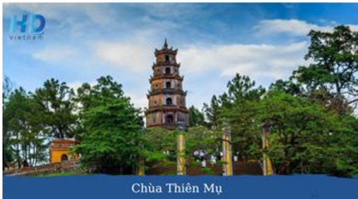
Chùa Thiên Mụ

Buổi chiều: Tham quan Đại Nội (Hoàng Cung của 13 vị vua triều Nguyễn, triều đại phong kiến cuối cùng của Việt Nam: Ngô Môn, Điện Thái Hoà, Tử Cấm Thành, Thế Miếu, Hiển Lâm Các, Cửu Đỉnh) và Chùa Thiên Mụ cổ kính, xây dựng từ những năm đầu của thế kỉ XVII.