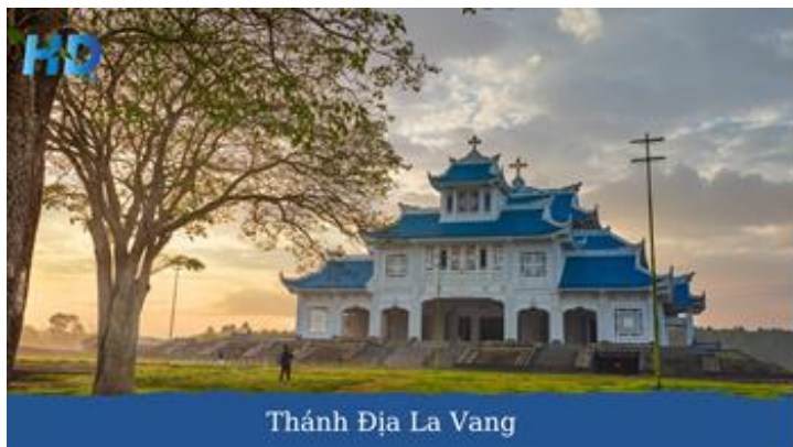
Thánh Địa La Vang

Buổi sáng: Quý khách dùng điểm tâm sáng, sau đó khởi hành đi Phong Nha. Tham quan Thánh Địa La Vang dạo bước khuôn viên bạn sẽ cảm nhận được sự dễ chịu, mát mẻ của những cây cổ thụ to lớn. Ngồi trước tượng Đức mẹ để tìm thấy sự thanh thản trong tâm hồn và thoải mái. Hay là xin nước thánh tại giếng nước thánh La Vang để cầu an lành và hạnh phúc. Ăn trưa nhà hàng tại Phong Nha.