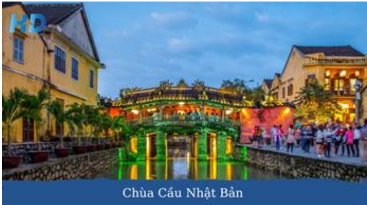
Chùa Cầu Nhật Bản

có tượng Phật Bà 67m hướng ra biển Đông. Tắm biển Mỹ Khê-một trong các bãi biển đẹp nhất hành tinh. Tiếp tục vào Hội An bách bộ tham quan và mua sắm Phố Cổ với: Chùa Cầu Nhật Bản, Bảo tàng văn hóa Sa Huỳnh, Nhà Cổ hàng trăm năm tuổi, Hội Quán Phước Kiến & Xưởng thủ công mỹ nghệ.