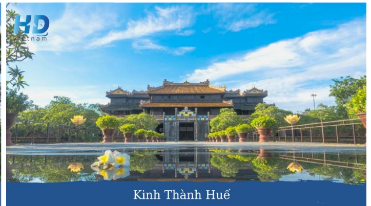
Kinh Thành Huế

Buổi tối: Ăn tối nhà hàng. Quý khách thưởng ngoạn Ca Huế sông Hương và thả hoa đăng cầu may mắn, mạnh khỏe, hạnh phúc (Chi phí tự túc). Quý khách được tặng gói dịch vụ Massage Foot trị liệu miễn phí. Ngủ KS tại Huế.